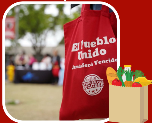
College, Career & Basic needs Resource fair