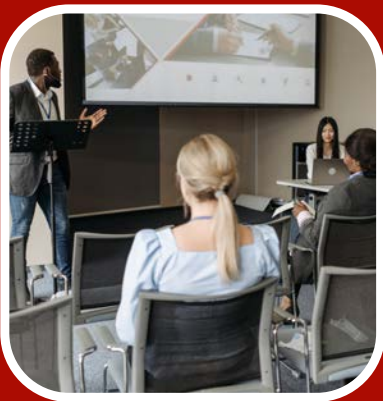
Talleres de Colegio y Carrera

Redes que inspiran, enseñan y elevan los sueños