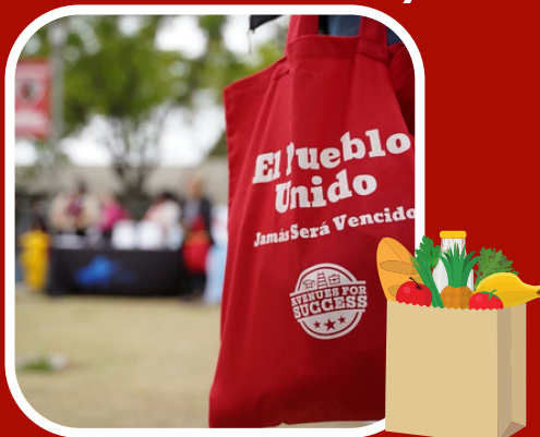
Colegio, Carrera y Feria de Recursos Basicos