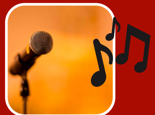
¡Entretenimiento para toda la familia!